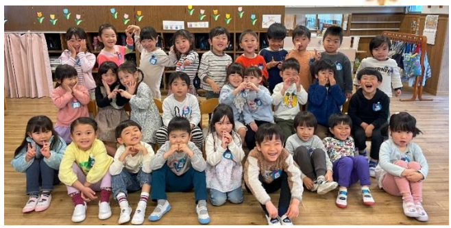
2024年度こひつじ2組28名です♡

温かい陽気になり、子どもたちの大好きな虫の季節です！外遊びで数名の子の興味をひいたのはダンゴムシ。見つけるとすぐに出てくる思いはやはり「飼いたい〜！」の思いです(笑)気持ちは受け止め、でも何もない家に閉じ込められたらどう思う？と話をしました。降園前に“やってみたい”“面白そう！”を見つけてくれたこと、そして命の大切さ、飼うなら調べて、準備が必要だとクラス皆で共有しました。すると次の日調べてきてくれた子がおり、飼ってみることに。登園するとリュックも持ったままダンゴムシの様子を見に行き、観察。「元気そう！」と嬉しそうに、優しく触ってよく観察していました。ダンゴムシの絵本や図鑑から、ヒモにも掴まれること、鉛筆の先にも掴まれることを知ると、実践。「ほんとに出来る！」とダンゴムシの生態に興味深々のこどもたちでした。